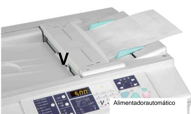
V.- Alimentadora automática